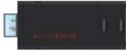
BS + 10 xxxxxx0000