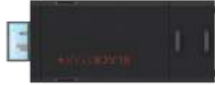
BS + 22 xxxxxx0000