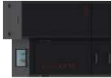
280 L silo xx0000120