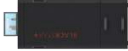
BS + 16 xxxxxx0000