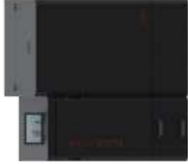
380 L silo xx0000220