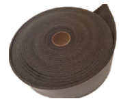
LIP Kantbånd 5X100MM X 25M